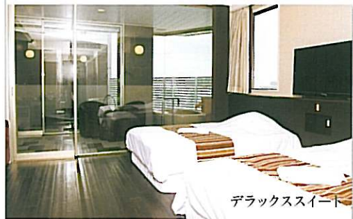
デラックススイート