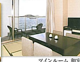
ツインルーム 和室