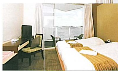
ツインルーム 洋室