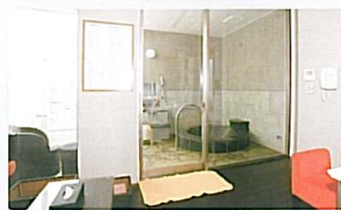
410 ヌサ インダー