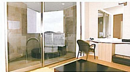
403 ウォーターリリー